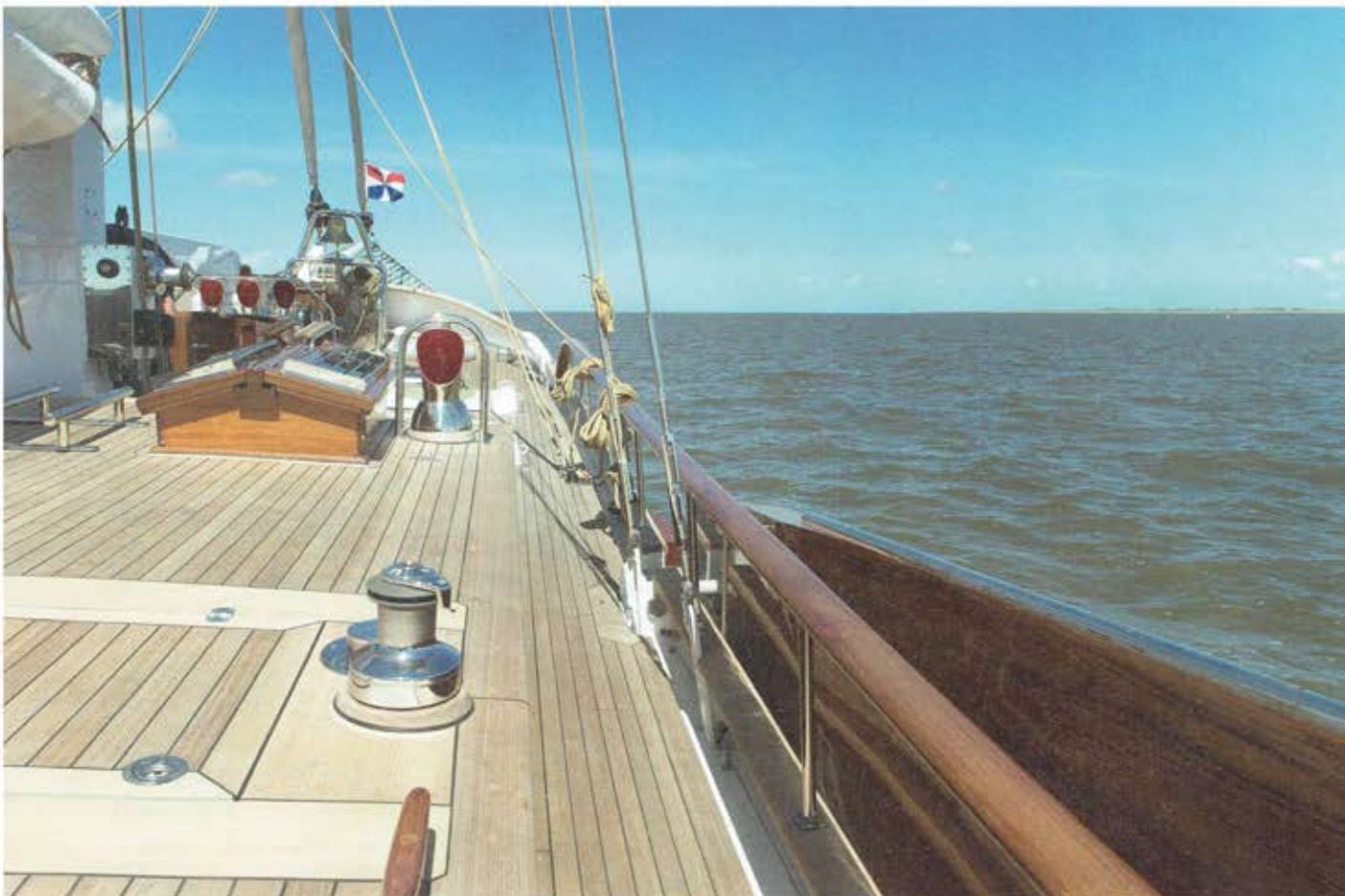
Het teak dek, de vele houtsnijwerken en luxe dekbeslag geven de tjalk het allure van een klein superjacht

Verder moest de bestaande onhandige dekingeling buiten helemaal opnieuw ontworpen worden. Het dek moest veilig en uiterst comfortabel gemaakt worden, voorzien van een 'buiten-zit' die voor diverse klimaten geschikt zou zijn. De eigenaar heeft al de InterCoastal van het noorden naar het zuiden door de VS gevaren; van een subarctisch naar een subtropisch klimaat. Ook Mexico en Venezuela waren zijn vaargebieden. Het rauwere klimaat van Nova Scotia had eveneens al op het programma gestaan - best bijzonder voor een Hollandse tjalk. →