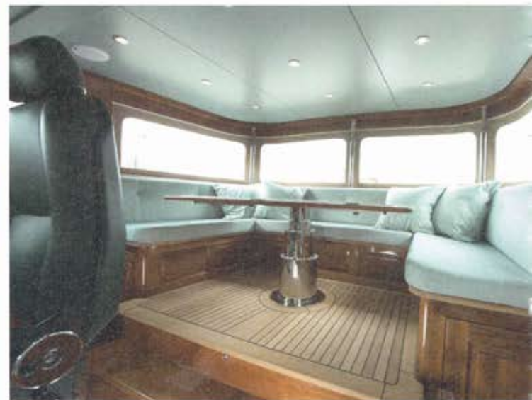
Achter de stuurstoel kan de salontafel telescopisch een stukje inzakken, waardoor er één grote uitspanning ontstaat.