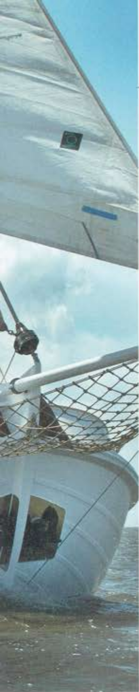
De eerste seatrial op de wadenzee doorstaat Vrouw Christina met vlag en wimpel

Een van de belangrijkste eisen van de hele operatie was dat een en ander op een natuurlijke en 'geruisloze' manier verwerkt moest worden in de bestaande, uitgesproken en haast iconische stijl en detaillering van het in- en exterieur. Dat bleek op zichzelf al geen sinecure want dit alles moest efficiënt worden afgestemd op de technuten die werkelijk op iedere plek van het schip zo hun eigen besognes hadden. Tussen de geïntegreerde bijzondere kunst in het interieur en de uitzonderlijke houtsnijwerken en detailleringen aan dek, moest een volledig nieuw concept gevoegd worden. Dat alles is wel bijzonder geslaagd en ook bij dit project bleek dat ondanks de best mogelijke zorg van de eigenaar er een aantal duidelijke lessen getrokken kunnen worden, wat betreft refits van jachten die internationaal worden gebruikt: door de jaren heen worden noodreparaties permanent; letterlijk ieder onderdeel krijgt op zee altijd meer op z'n donder dan je al dacht; wereldwijd zijn er teveel bedrijven die reparaties en onderhoud gewoon helemaal niet goed doen; en niet onbelangrijk, het valt helemaal niet mee je