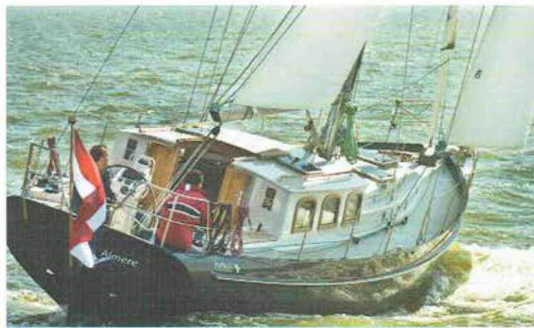
De door VMC gebouwde Puffin 37 is geheel gemoderniseerd.