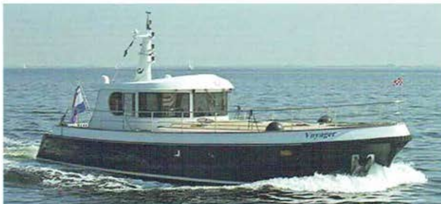
De Goodvaer met zijn stuurhuis met rechtopstaande, rondlopende ramen was een ontwerp dat in de jaren go zijn tijd vooruit was.