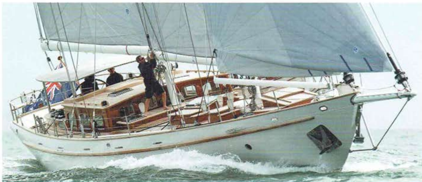
De Wolfhound, een 19,55 meter lange klassiek gelijkende schoener van composiet, in Engeland gebouwd, is dit jaar in de prijzen gevallen.

gewaardeerd óf verguisd. Ik was er te vroeg mee; pas jaren later werd deze vormgeving mainstream. Van een ander ontwerp met een vergelijkbare stijl, de Goeree, zijn er veel gebouwd."