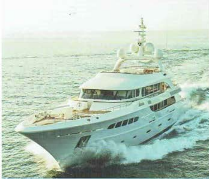
"Mooie lijnen zonder poespas", zegt Van Meer over zijn Nassima ontwerp, een in 2012 door Acico Yachts in Enkhuizen gebouwd 49 meter jacht.