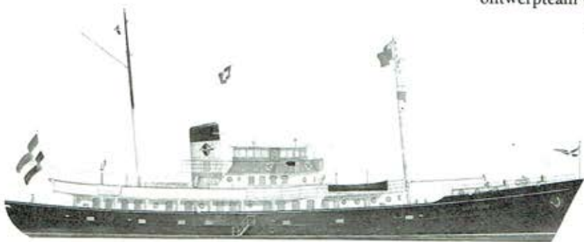
Klassiek motorjacht, vijftig meter.

Aan de succesvolle Puffin serie is een 46 voeter toegevoegd. Het eerste jacht, dat ook tevens de eerste aluminium Puffin is, is momenteel in aanbouw bij De Gier & Bezaan. Het jacht wordt uit-